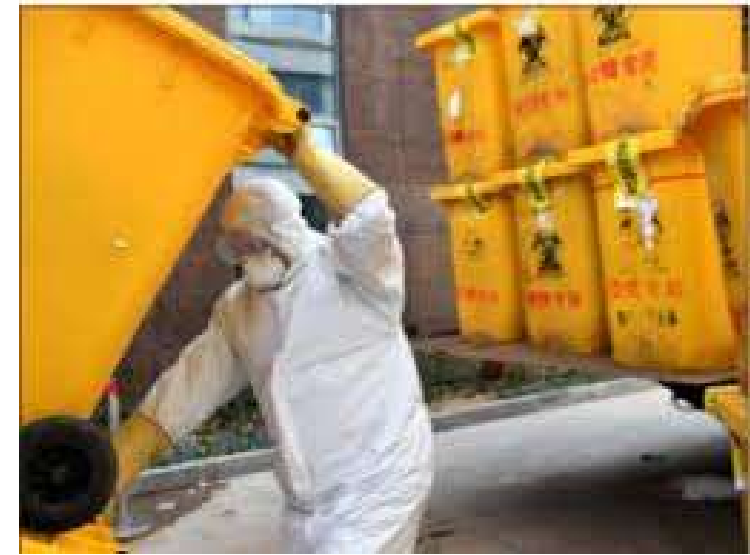
транспортування спеціалізованим транспортом