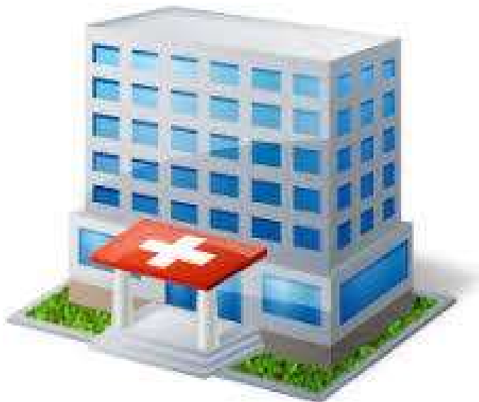
заклади охорони здоров'я