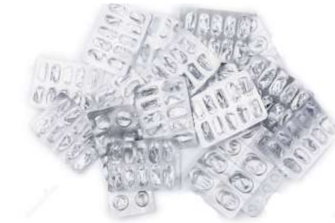
первинна упаковка лікарських засобів