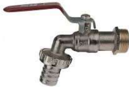
умивальник і кран для поливу