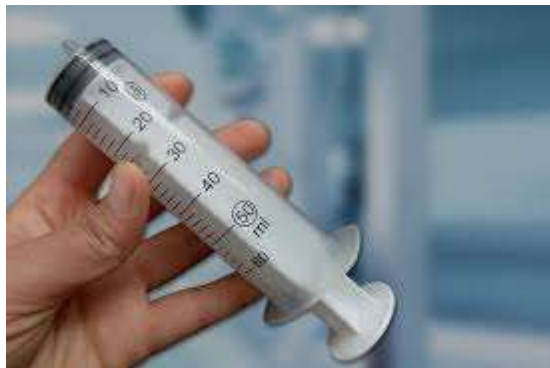
шприц без голки