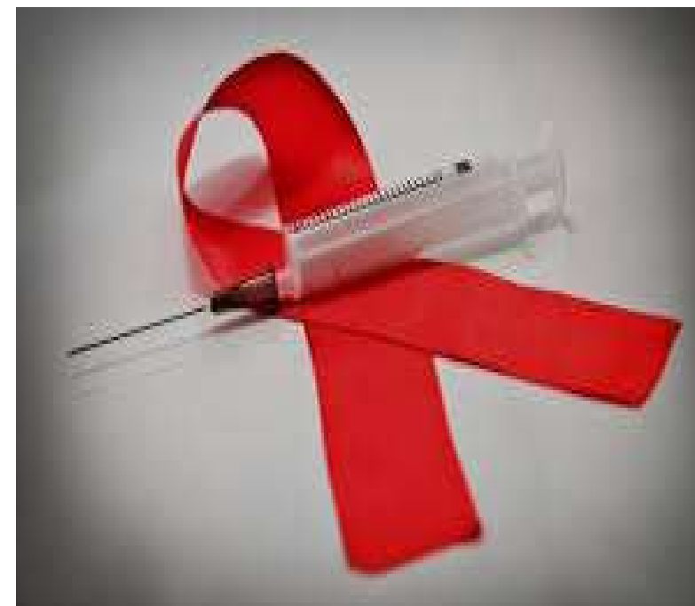
громадські об'єднання і благодійні організації у сфері протидії ВІЛ