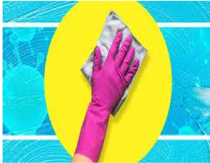
дезінфекція зовнішніх поверхонь ємностей (гіпохлорит натрію, йодофор- і фенолвмісні деззасоби, ЧАС)