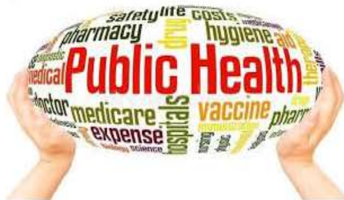
заклади громадського здоров'я