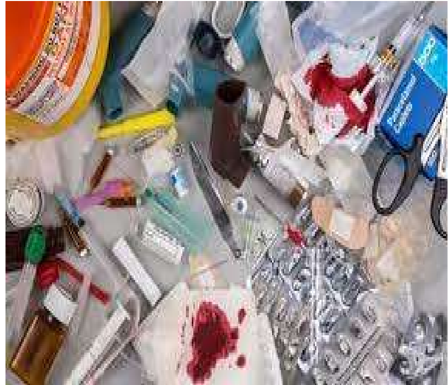
медичні відходи, що утворюються в побуті