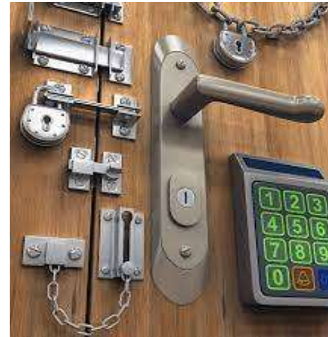
попередження доступу сторонніх