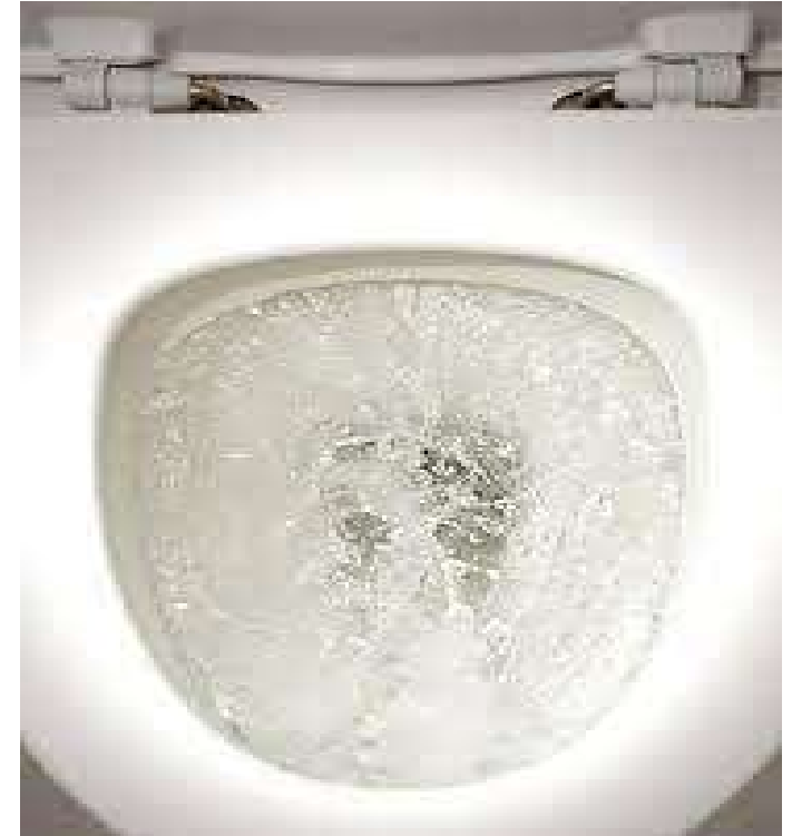
злиття в загальну каналізаційну мережу