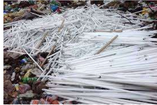
відходи від обладнання для освітлення