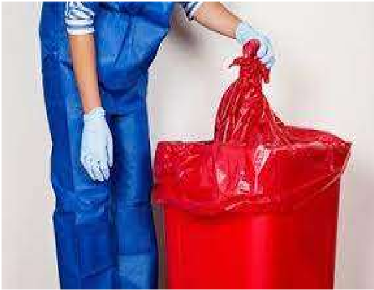
подвійне пакування і маркування