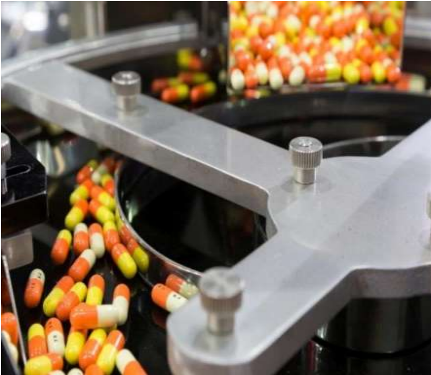
відходи виробництва фармацевтичної продукції