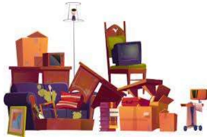
контаміновані великогабаритні відходи після дезінфекції